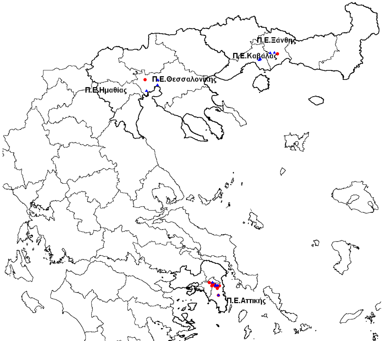
Εικόνα 2: Χάρτης με αποτύπωση του πιθανού τόπου έκθεσης των δηλωθέντων ασθενών με εργαστηριακή διάγνωση λοίμωξης από τον ιό του Δυτικού Νείλου, Ελλάδα, 2013, έως 14.08.2013, ώρα 10.00 (n=26).