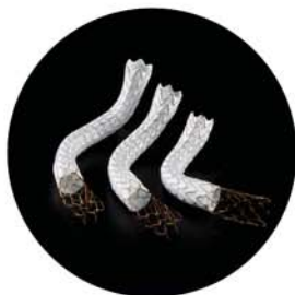
GORE® VIATORR® TIPS Endoprosthesis with Controlled Expansion